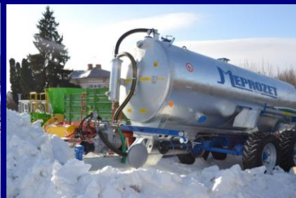
Echipamente procurate în cadrul proiectului, necesare fluxului tehnologic din ferma de vaci