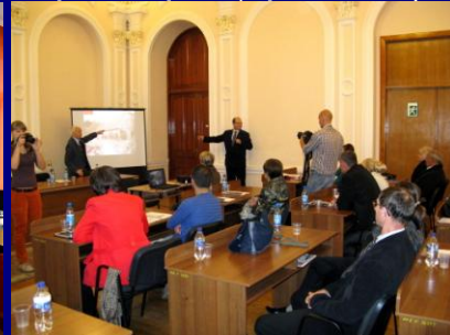
Ucraina și Republica Moldova, octombrie 2014