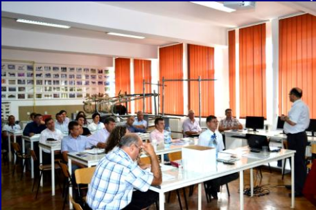
România, iulie 2014

Trei serii de instruire a câte două zile privind bunele practici în creșterea bovinelor, organizate în România, Ucraina, Republica Moldova (20 participanți pe serie)