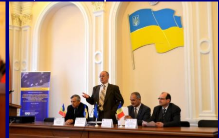
Workshop la Odessa - 60 beneficiari din Ucraina, 10 din Republica Moldova, 10 din România