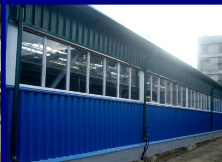
Ferma din Chișinău – dare în folosință la finele lunii noiembrie 2015