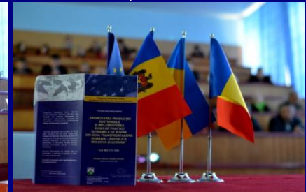
Workshop la Chișinău - 60 beneficiari din Republica Moldova, 10 din România, 10 din Ucraina