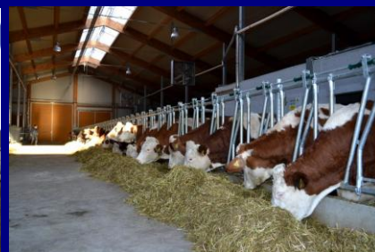
Ferma din Iași-Rediu, funcțională din luna iunie 2015