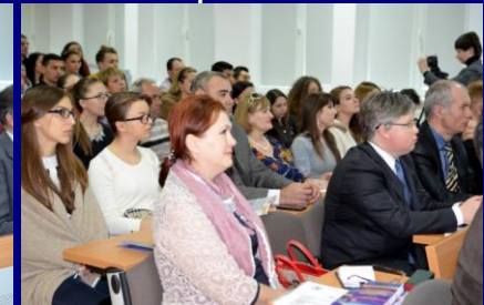
Workshop la Iași - Peste 60 beneficiari din România, 10 din Ucraina, 10 din Republica Moldova