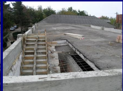
Etape din consolidarea și construcția centrului de monitorizare a calității produselor bovine, sediul viitoarelor laboratoare de specialitate