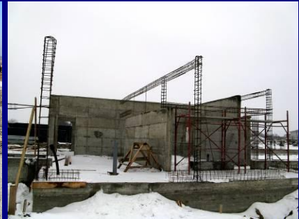
Etape din execuția birourilor și a sălii de muls