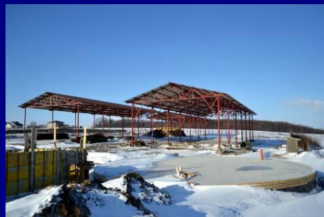
Etape din execuția bazinului de colectare a dejecțiilor