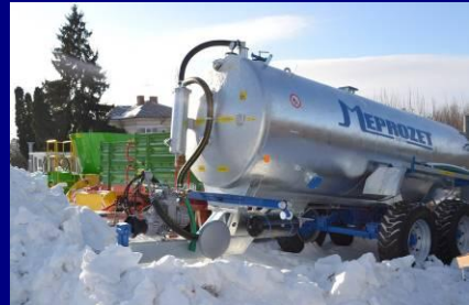
ECHIPAMENTE PROCURATE ÎN CADRUL PROIECTULUI, NECESARE FLUXULUI TEHNOLOGIC DIN FERMA DE VACI