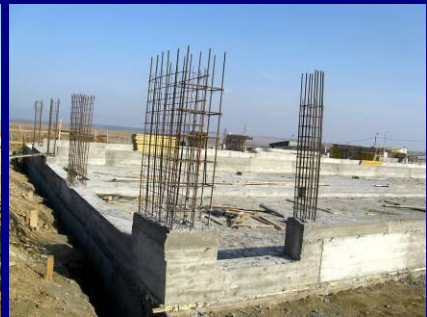
Etape din execuția fundației și a platformei adăpostului de vaci